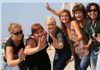
Encontro Preparatório 11 de Setembro de 2007

Tudo começou em Beekbergen, na Holanda, em Novembro de 2006, quando um grupo de Técnicos de várias instituições que trabalham na área da deficiência, nos mais diversos países da Comunidade Europeia, se juntou, com o objectivo de encontrar parceiros para o desenvolvimento de Projectos em conjunto.