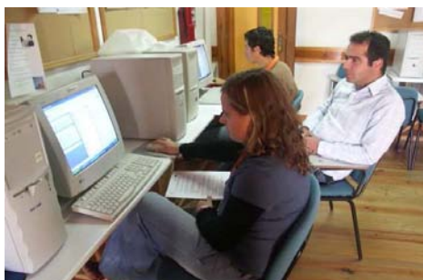
Formação em Tecnologias de Informação e Comunicação