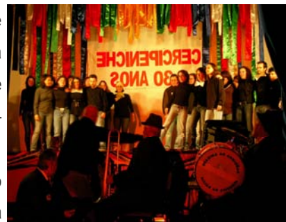
Oficina de Teatro do Centro de Reabilitação Profissional de Peniche

que tornaram esta noite tão especial e que ficou certamente na memória de muitos. A Oficina de Teatro do Centro de Reabilitação Profissional de Peniche, marcou presença com as peças “Loas à Chuva e ao Vento” e Orquestra Renhónhó.