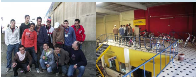
Visita à Empresa J. Nascimento da Luz, Lda—Duas Rodas

No dia 24 de Janeiro, foi a vez de um grupo de onze formandos ficarem a conhecer mais de perto a Empresa J. Nascimento da Luz, Lda - Duas Rodas, uma empresa local na área da venda e reparação de Motociclos.