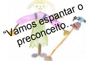
Tema do Concurso de Espantalhos